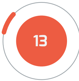
• ○ اسکولوں اور کالجوں کی تعداد