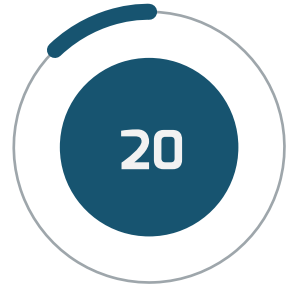
• ○ اسکولوں اور کالجوں کی تعداد