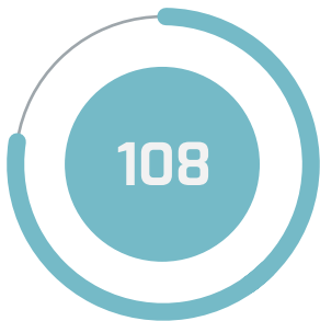
• ○ اسکولوں اور کالجوں کی تعداد

درج ذیل گرافکس میں فخریہ نصاب کے سرکاری اسکولوں اور کالجوں کی تعداد کی تفصیلات دی گئی ہیں۔ فخریہ نصاب کے سرکاری اسکولوں اور کالجوں کی تعداد کی تفصیلات فخریہ نصاب کے سرکاری اسکولوں اور کالجوں کی تعداد کی تفصیلات